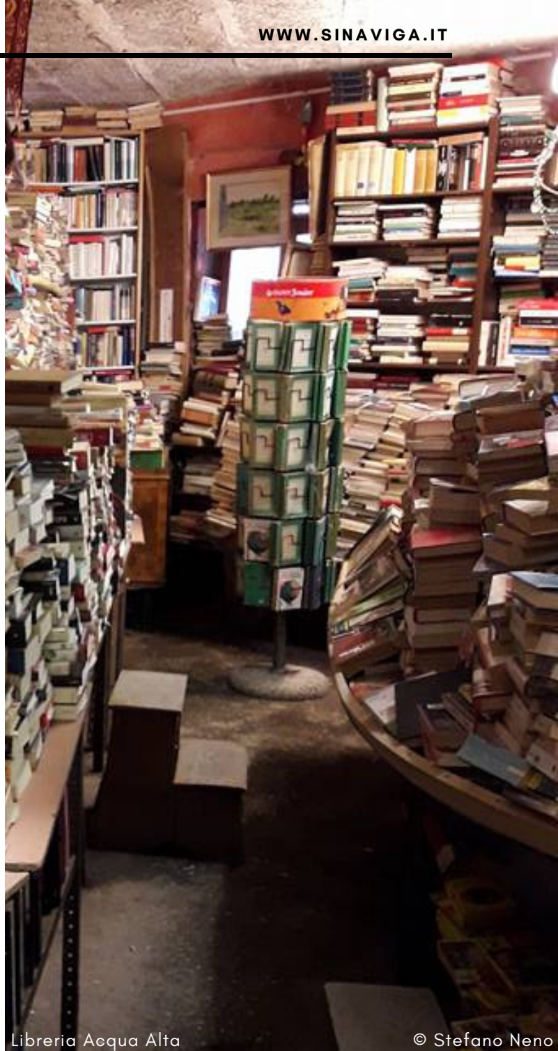
Libreria Acqua Alta

Qualcosa in più: se non siete troppo stanchi, suggerisco una visita all'Isola di San Pietro di Castello, raggiungibile a piedi, attraverso un ponte. Questa è la prima Basilica di Venezia, più vecchia di quella di San Marco.