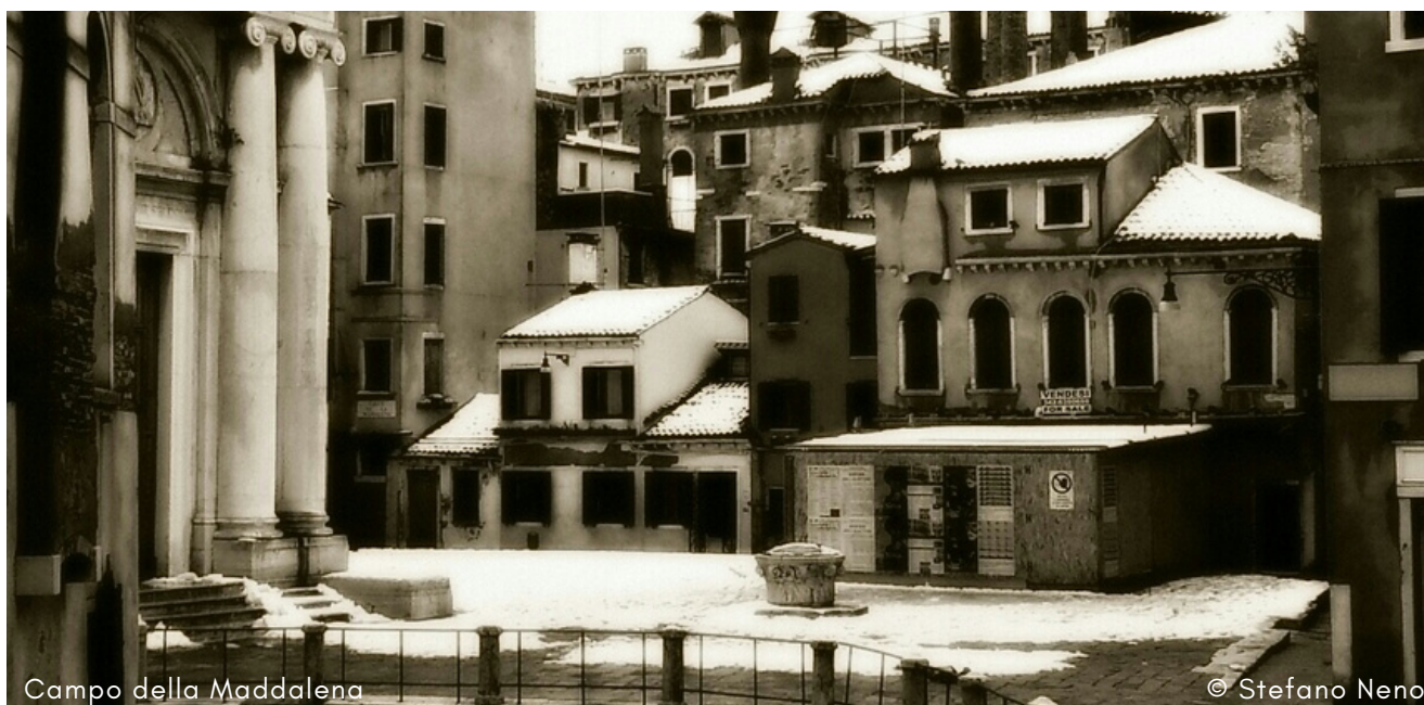
Campo della Maddalena