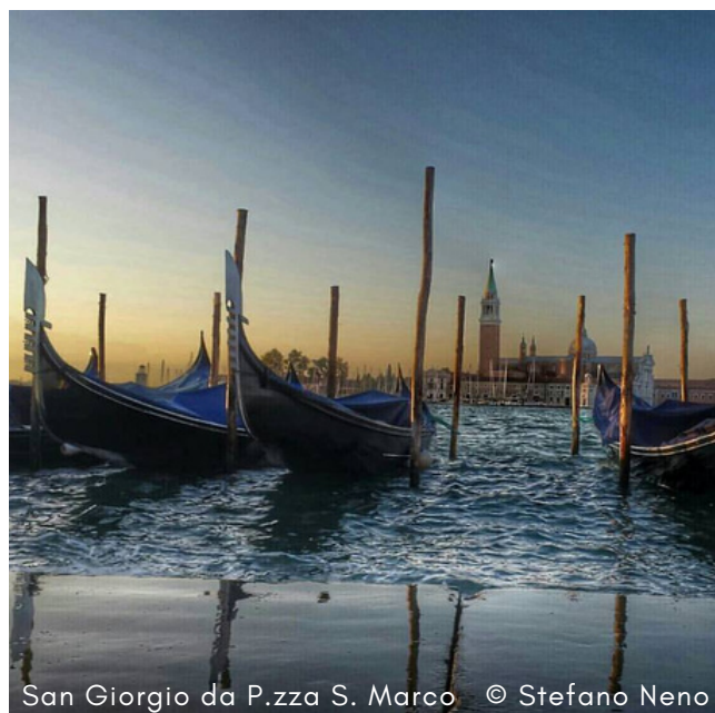
San Giorgio da P.zza S. Marco

Qualcosa in più: Ca' Rezzonico è uno dei più belli Palazzi di Venezia. Al primo piano, ognuna delle 11 stanze contiene pitture, quadri, sculture e affreschi del 1700 veneziano. Da vedere!