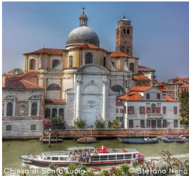
Chiesa di Santa Lucia