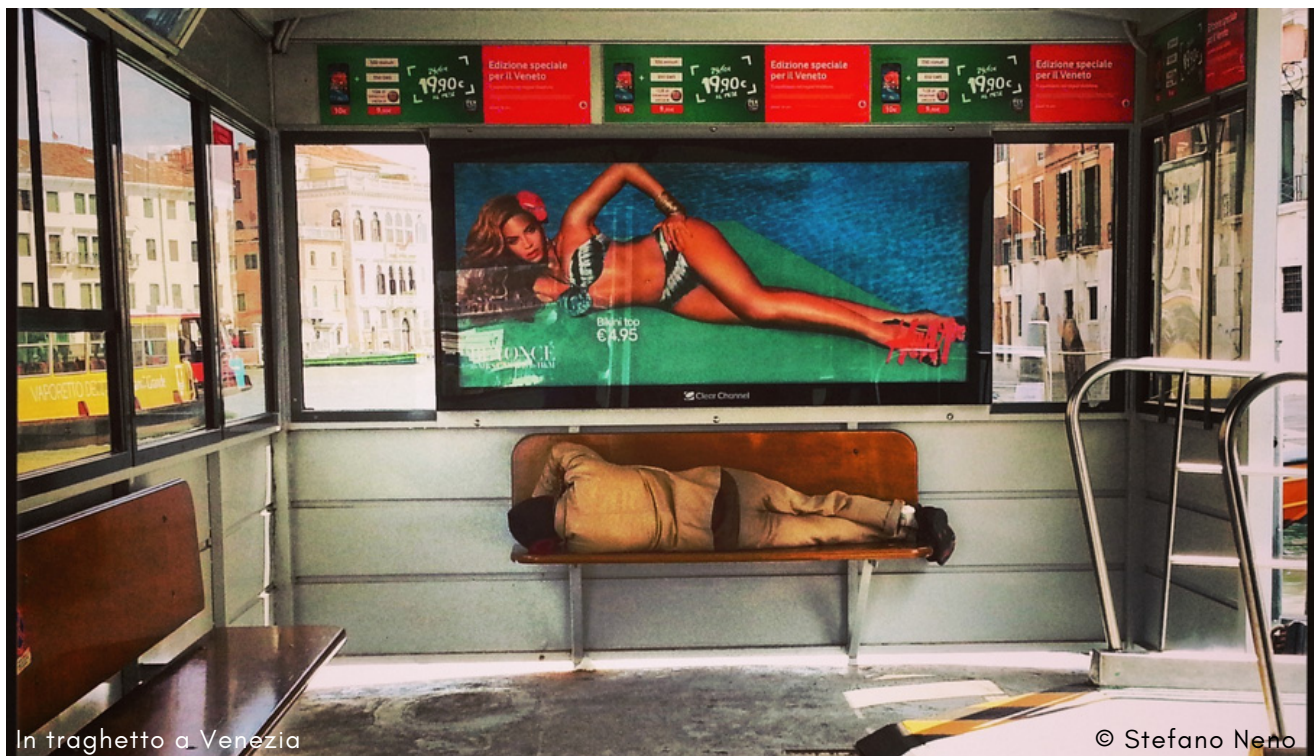
In traghetto a Venezia