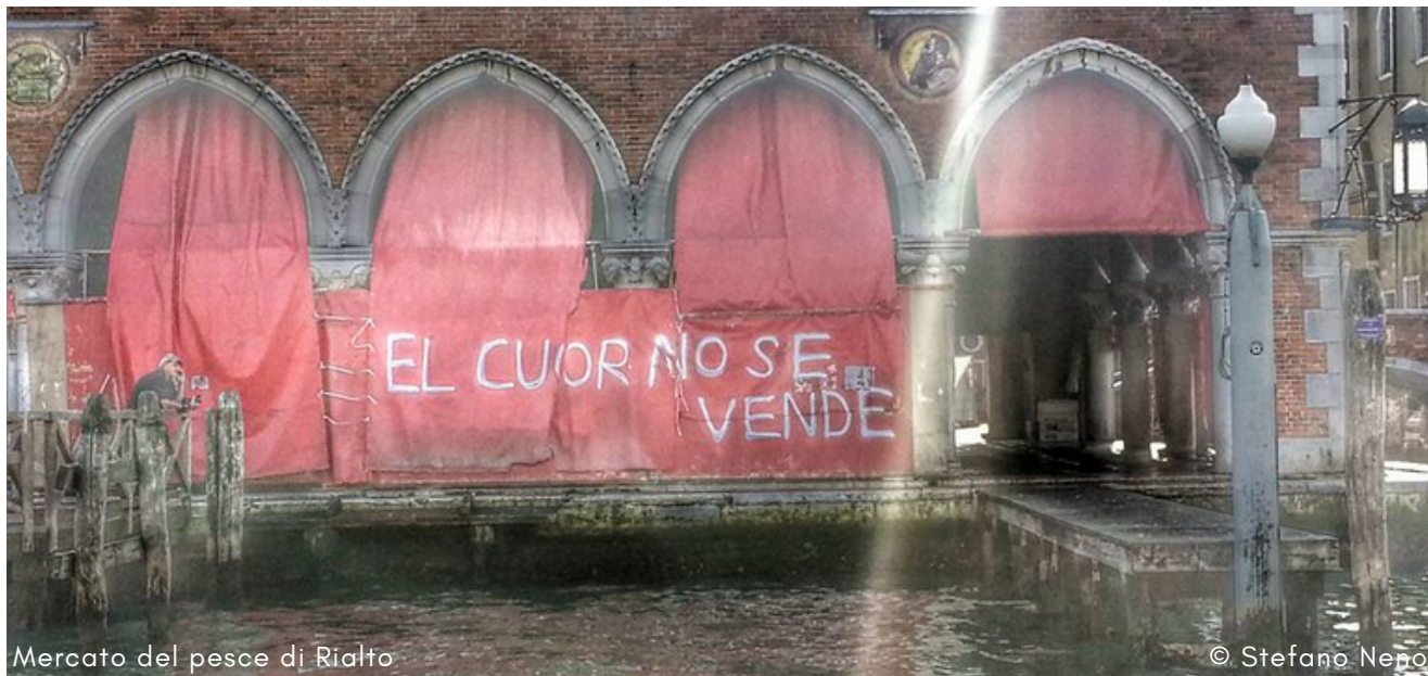
Mercato del pesce di Rialto