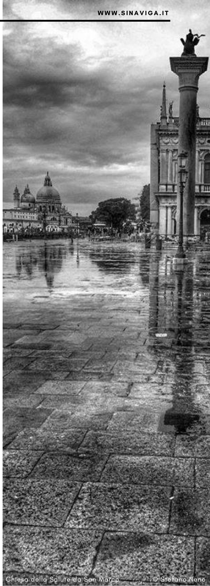
Chiesa della Salute da San Marco