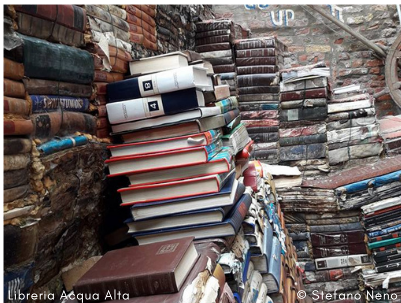
Libreria Acqua Alta